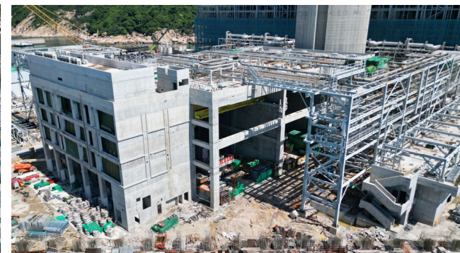
渦輪發電站正進行設備安裝