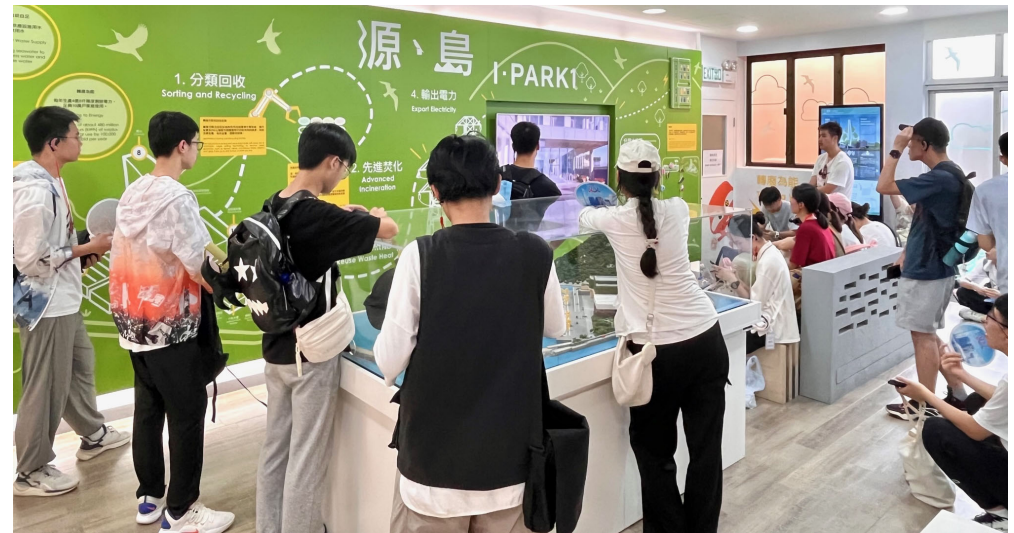
06/08/2024 浙江省余姚中學參觀