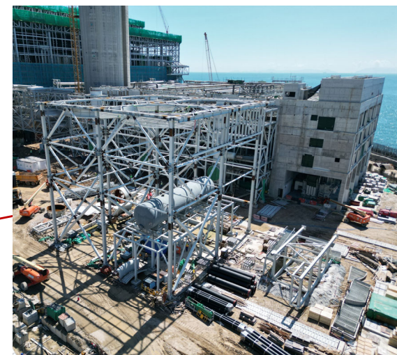
風冷式冷凝器安裝