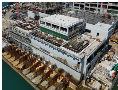
海水化淡廠上部 結構7月完成，正 進行內部裝飾及 設備安裝