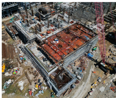
行政樓上部結構施工 進行中