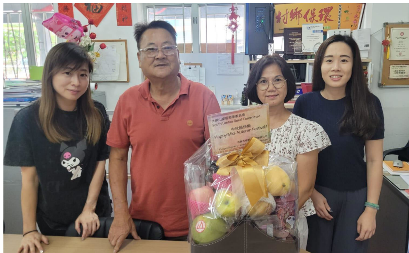
大嶼南鄉事委員會