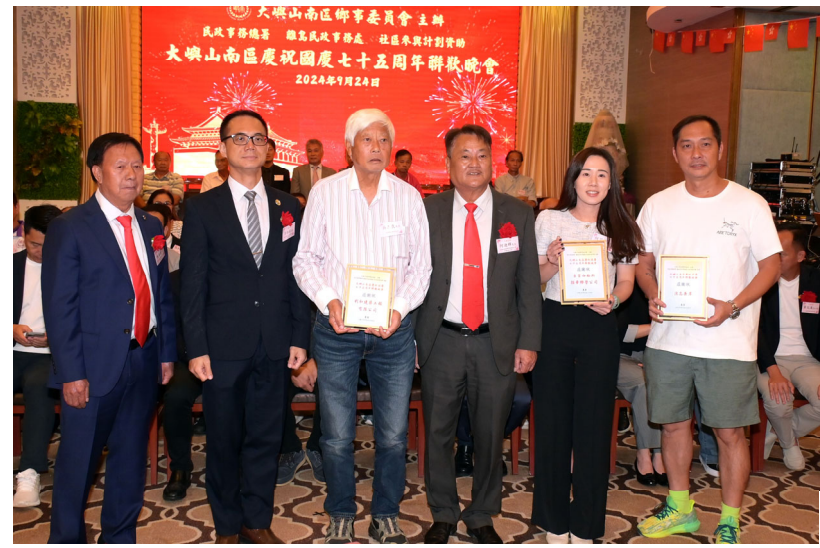
24/09/2024 大嶼山南區慶祝國慶75周年聯歡晚會