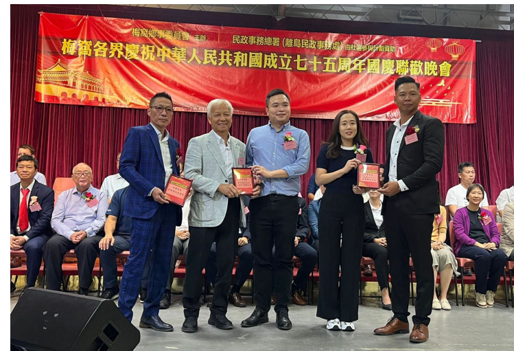
30/09/2024梅窩各界慶祝中華人民共和國成立75周年國慶聯歡晚會